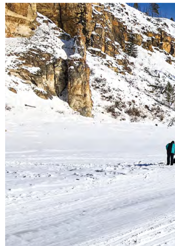
Зимник, идущий вдоль Лены. Республика Саха (Якутия)