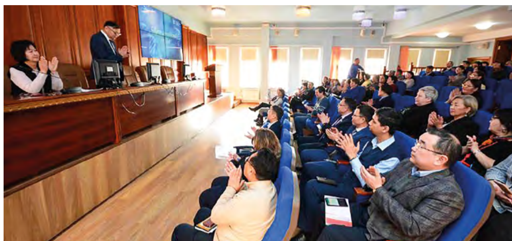
День российской науки в Бурятском государственном университете

материалы, демонстрирующие развитие бурятской академической науки.