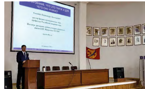
Объединенное заседание Координационного научного совета при губернаторе Иркутской области и Президиума ИрФ СО