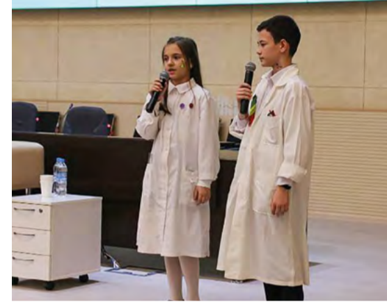
Участники ток-шоу «Наука по новым правилам»