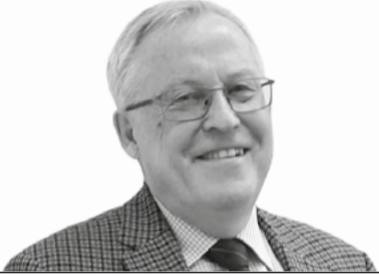
В. А. Крюков

Именно к такому выводу пришли ведущие ученые Сибирского отделения РАН, обсудив недавно утвержденную стратегию на заседании Президиума СО РАН.