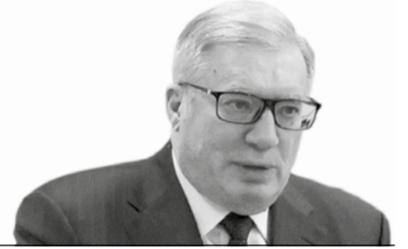
В. А. Толоконский

В ходе дальнейшего обсуждения проблемы разработки плана реализации стратегии советник губернатора Новосибирской области Виктор Александрович Толоконский подчеркнул значимость перспективного целеполагания как деятельности общества: «Нельзя принижать важность стратегического планирования в России. Это значимая часть жизни общества. Если оно не видит картины будущего, мотивация резко падает».