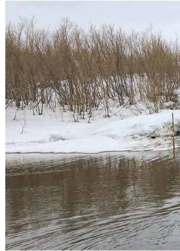
Переправа через уже закрывшийся зимник. Игарка, КР

«Когда мы делали анализ изменения климата по метеостанциям, то смотрели его в разбивку по месяцам, и там хорошо видно: осенью, по крайней мере за последние 60 лет, температура если и меняется, то не сильно. То есть осенний период по продолжительности сравни-