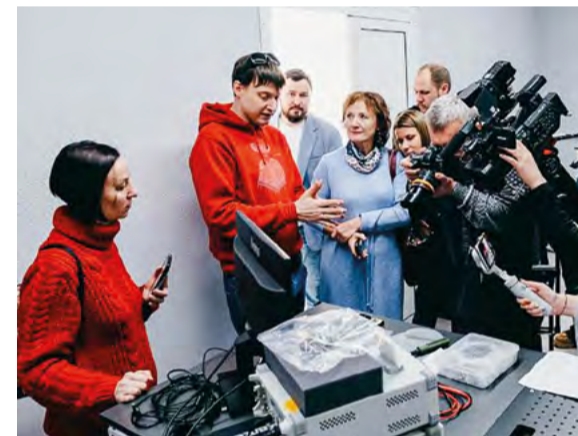
Представители СМИ в лаборатории фотоники молекулярного Института физики им. Л. В. Киренского СО РАН