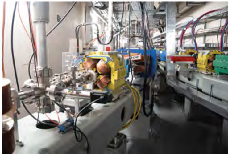
Выход пучка из линейного ускорителя в бустерное кольцо