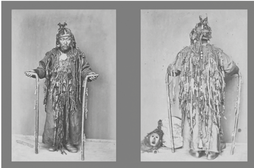
Бурятский шаман. Открытка начала XX века

Во все свои годы, На протяжении своего счастья О потомстве и его корнях думать не буду, Ни имени, ни прозвища не вспомню. Любимого сына, Милую дочь, Чтобы ласкать на коленях, Чтобы подбородком прижимать, В колыбели качать, О процветании моих потомков думать не буду, Сладость минутной любви, Сила мимолетного влечения Будут целью моей жизни, На протяжении жизни Искать буду, Преследовать буду, Лелеять рожденных с соплями, Ласкать в колыбели не стану, На стройных красивых женщин буду смотреть, Еще красивее девушек буду искать,