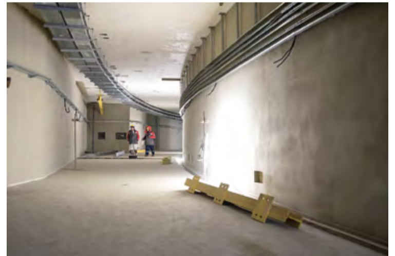
Основное кольцо-накопитель сейчас строится

Бустерный синхротрон — это основной ускоряющий элемент комплекса, который поднимает энергию пучка с уровня 200 миллионов до 3 миллиардов электрон-вольт. В этом кольце ускорение пучка до рабочей энергии СКИФ происходит примерно за полсекунды, после чего уже на рабочей энергии он по специальному транспортному каналу перепускается из бустерного синхротрона в основное кольцо.