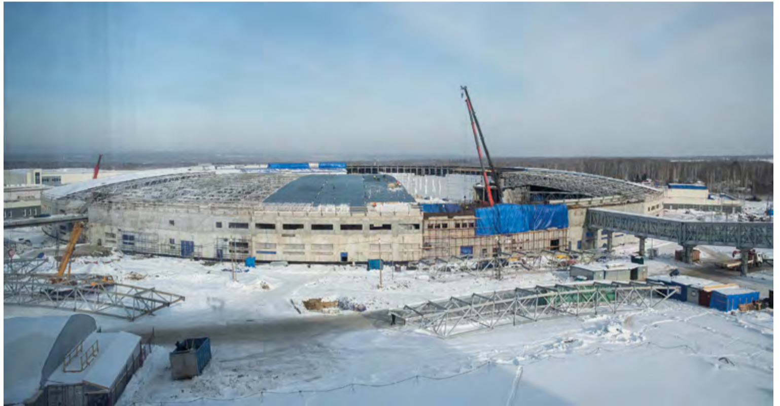
Общий вид кольца-накопителя, где в будущем появятся исследовательские станции

Линейный ускоритель инжекционного комплекса Центра коллективного пользования «Сибирский кольцевой источник фотонов» вышел на проектные параметры. Пучок электронов в ускорителе достиг энергии 200 МэВ, проведен через транспортный канал в бустерный синхротрон и был зарегистрирован на люминофорном датчике бустера.