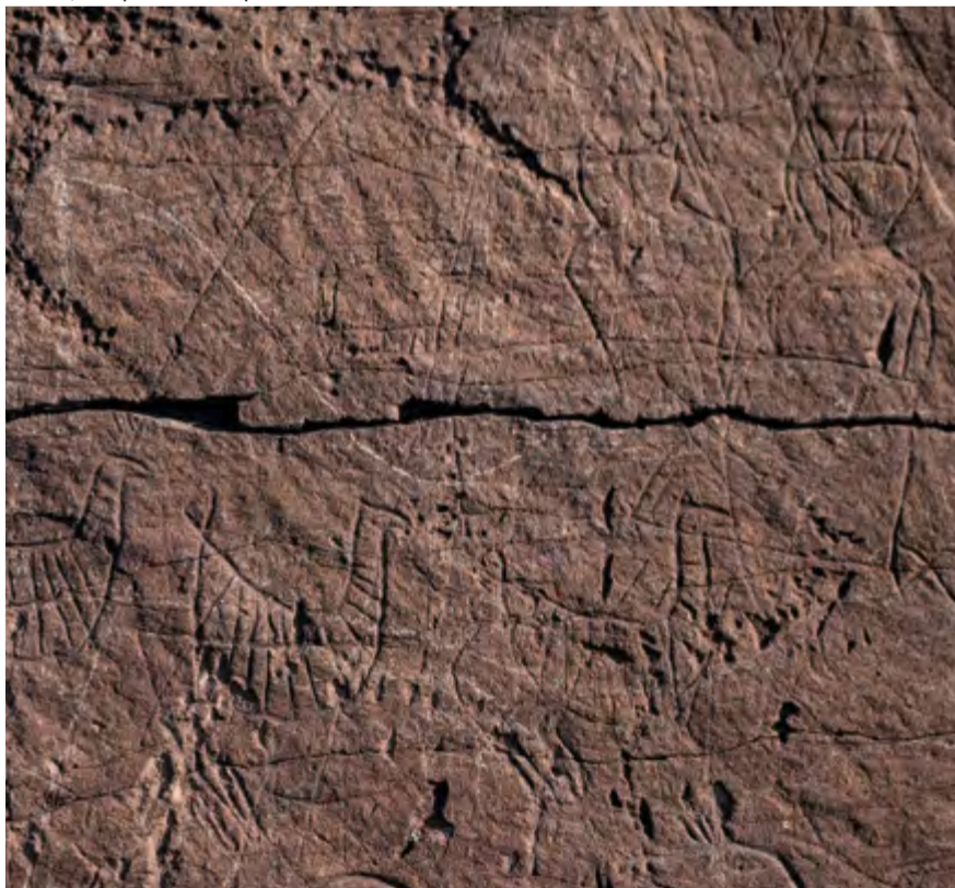
Предположительные фигуры богов Тенгри и Умай (фигуры в коронах)