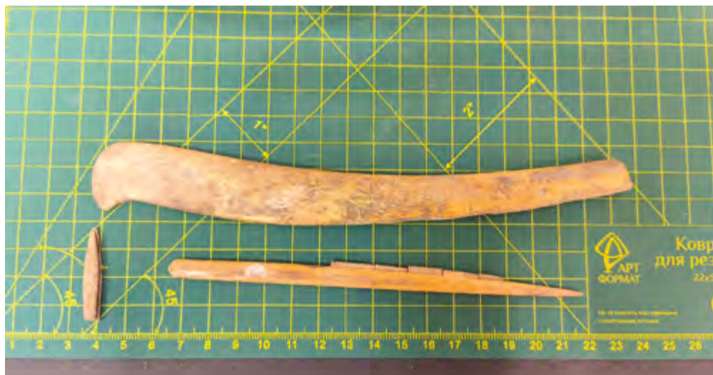
Составные пазовые орудия. слева — наконечник для стрелы или копья, снизу — орудие с сохранившимися вкладышами, сверху — рукоятка

Исследование проводится при поддержке Российского научного фонда (проект № 24-28-01157 «Вкладышевые технологии Восточной Сибири конца плейстоцена — начала голоцена»). КТ-исследование выполнялось с использованием приборной базы Центра коллективного пользования «Геохронология кайнозоя» ИАЭТ СО РАН (Новосибирск). Исследование проводилось в лаборатории «Цифра» ЦКП Института археологии и этнографии СО РАН на базе системы компьютерной микро-томографии высокого разрешения «Продис. Компакт» в исполнении 1215CG, предназначенной для получения, обработки и хранения цифровых рентгеновских изображений от источника ионизирующего излучения.