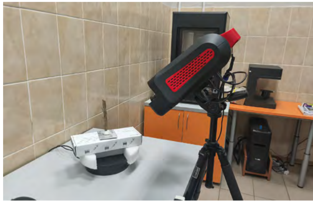
3D-сканер лаборатории «Цифра» ИАЭТ СО РАН

Вся это реконструкция операций — повтор действий, которые могли выполнять люди тысячи лет назад. После этого экспериментальное орудие изучают с помощью микрокомпьютерной томографии, чтобы увидеть микроразрушения от работы. Эти следы сравнивают с теми, что есть на археологической находке. Известно, что разные виды обработки (резка, скобление, удары) оставляют уникальные следы, и, сравнивая их между собой, можно идентифицировать, как использовался археологический предмет, по аналогии