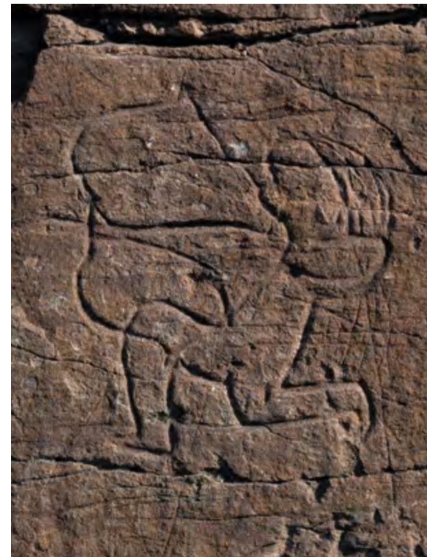
Лучник, стреляющий с колена