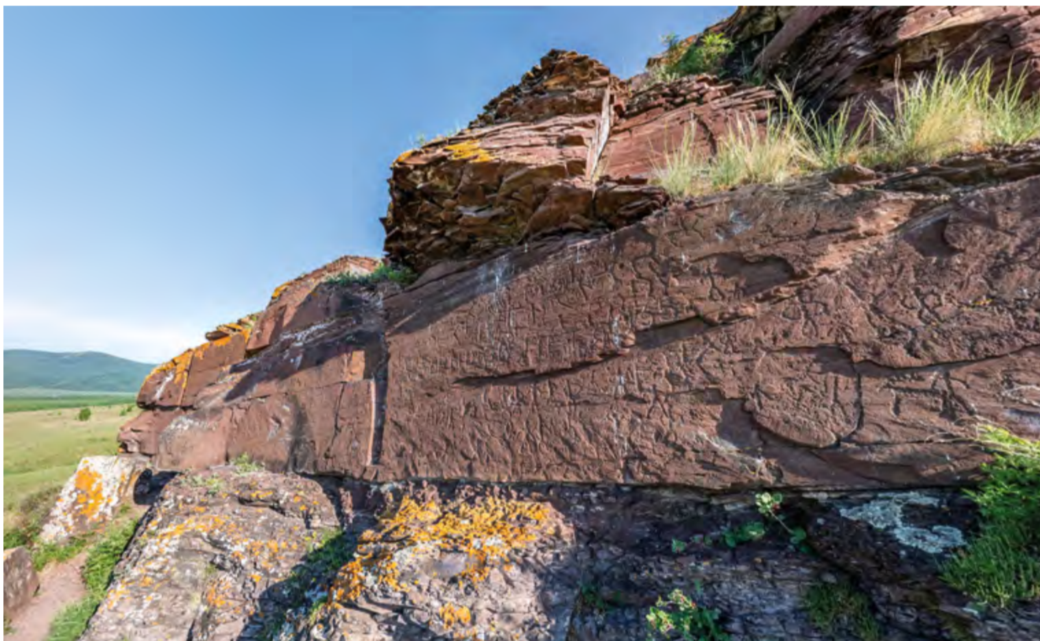
Скала, покрытая изображениями