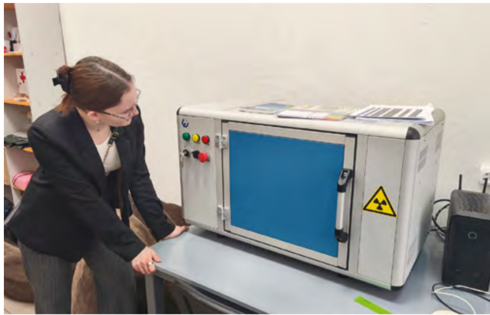
Компьютерный томограф лаборатории «Цифра» ИАЭТ СО РАН

Составные ножи, дротики, наконечники — все эти инструменты наши предки научились создавать в конце каменного века. В основе таких орудий — костяная рукоятка с пазами, в которые вклеивались тонкие каменные лезвия. Удобнее изучать их с помощью томографии, у которой есть масса применений. Ученые из лаборатории «Цифра» Института археологии и этнографии СО РАН начали исследовать эти артефакты, делая их компьютерные томограммы и 3D-модели.