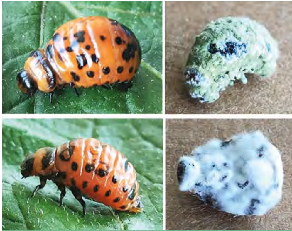
Развитие инфекций, вызываемых грибами Beauveria bassiana (сверху) и Metarhizium robertsii (снизу) у личинок колорадского жука. Слева — симптомы развития микоза: темные пятна под кутикулой, представляющие собой скопления гемоцитов, необходимые для инкапсуляции и инактивации патогена. Справа — погибшие жуки с формирующимся дочерним спороношением грибов

В совместной работе с коллегами из Института искусственного интеллекта Московского государственного университета им. М. В. Ломоносова (Москва), ФИЦ «Институт цитологии и генетики СО РАН» и Института химической кинетики и горения СО РАН ученые ИСиЭЖ выполни-