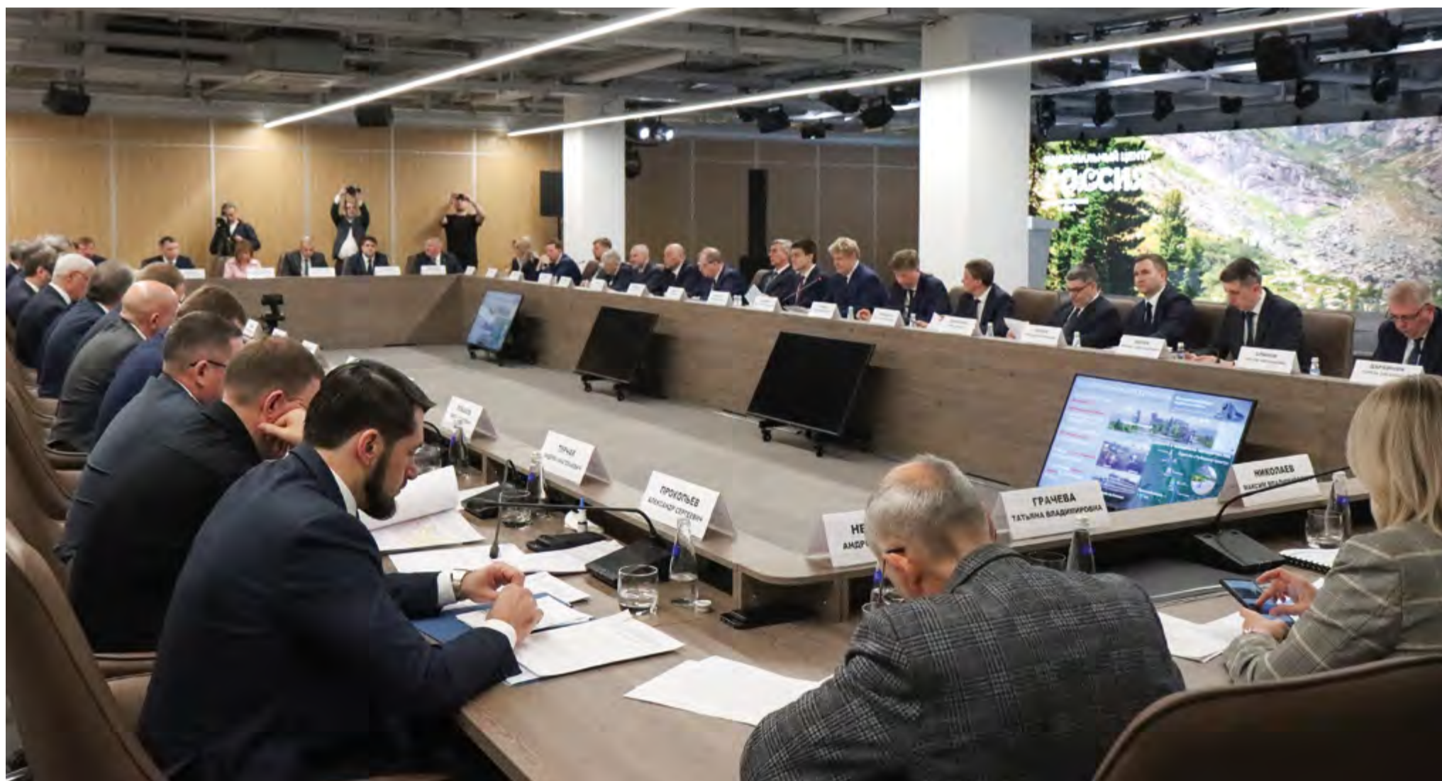
Заседание Совета СФО, посвященное развитию внутреннего туризма, в Красноярске