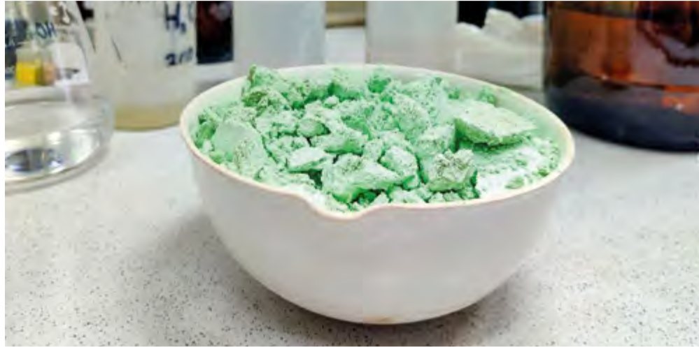
Катализатор на основе никеля

Аминирование проводят в специальном реакторе, который представляет из себя трубку, куда непрерывно подают нужные вещества: они проходят через слой катализатора, ускоряющего реакцию, и выходят с другой стороны уже готовыми продуктами. «Существует два вида реакторов: реактор периодического действия, в котором процесс начинается после загрузки всех компонентов, идет определенное время, а затем останавливается для извлечения готового продукта, и реактор проточного (непрерывного) типа,