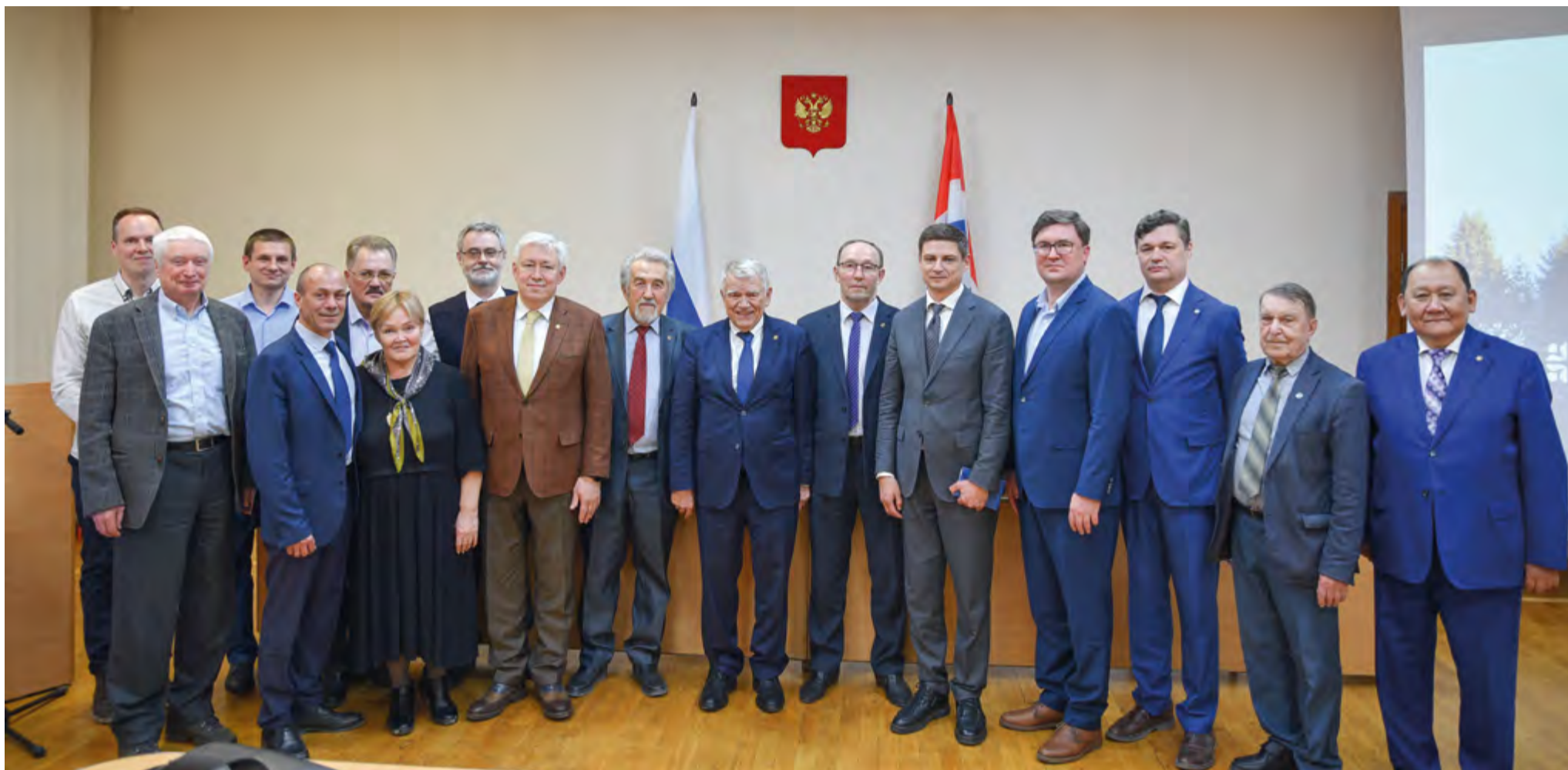
Участники выездного заседания Президиума СО РАН