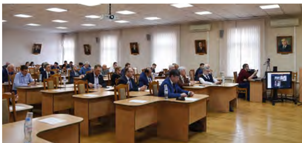
Заседание выездного Президиума СО РАН в Сибирском государственном университете инженерии и биотехнологий