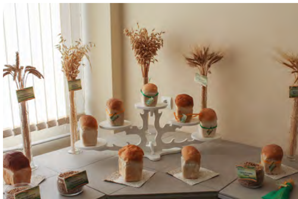
Продукция Омского аграрного научного центра