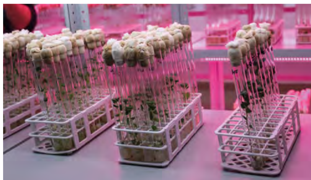
В фитотроне Омского АНЦ