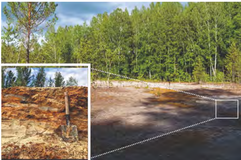
Общий вид хвостохранилища Талмовские Пески с выделенным фрагментом стенки шурфа

«Наше исследование показывает красивую синергию экономики и экологии. Осваивать техногенные месторождения барита не только возможно, но и экономически выгодно. Предложенная нами простая гравитационная схема обогащения делает переработку рентабельной. Таким образом, мы получаем двойной эффект: снижаем экологическую нагрузку на промышленные регионы, утилизируя хвостохранилища, и возвращаем