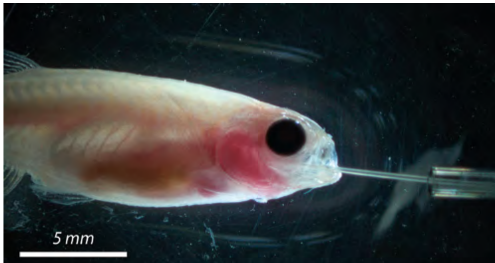
Генетически модифицированные прозрачные рыбки данио-рерио

Сотрудники Института неорганической химии им. А. В. Николаева СО РАН синтезировали двумерные металл-органические каркасы на основе европия, иттрия и тербия. Совместно с коллегами из Университета ИТМО из этих структур ученые получили ультратонкие нанолиты, способные проявлять люминесценцию зеленого, красного и синего цвета. Разработка сибирских химиков может использоваться в изготовлении оптических зондов для проведения биомедицинской визуализации и диагностики различных заболеваний. Статья об этом опубликована в журнале ACS Applied Nano Materials.