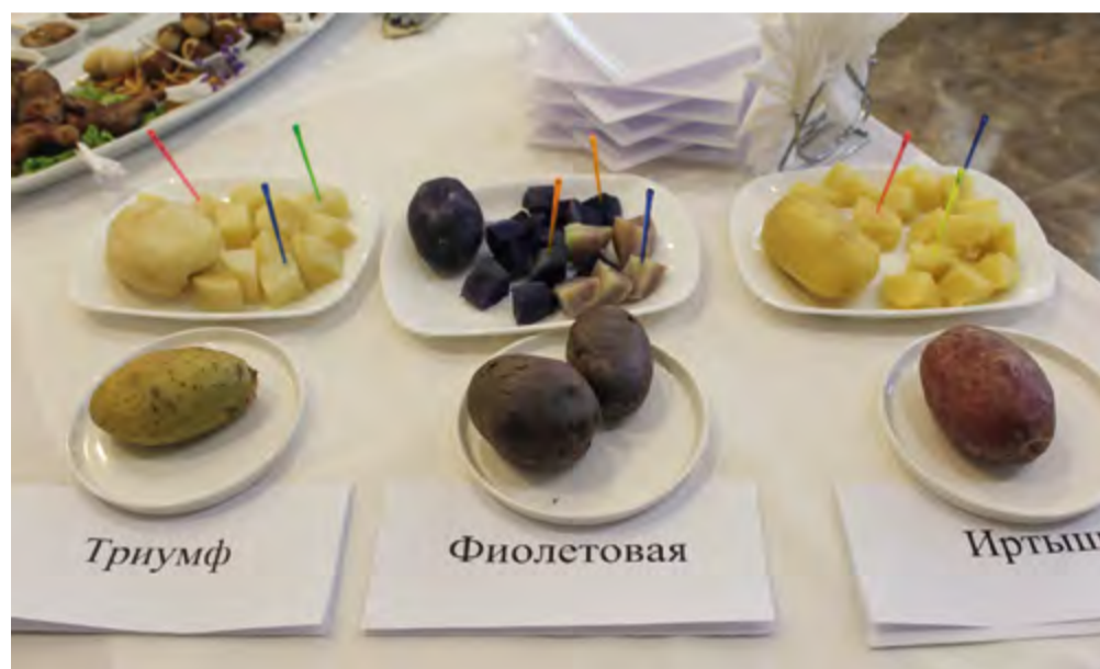
Новые сорта картофеля Омского АНЦ

является важным, но не единственным путем к эффективности исследований. Вторым условием успешной реализации научного проекта глава СО РАН назвал наличие квалифицированного заказчика: «Всё начинается с людей, которым интересно что-то изучать, и кончается людьми, которым интересно это использовать».