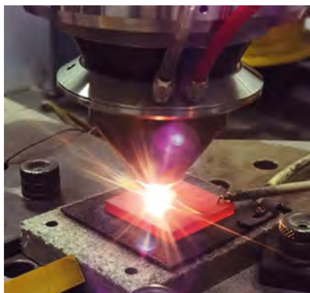
Процесс лазерной наплавки с использованием модуля предварительного нагрева подложки

Ирина Баранова Фото автора и предоставлено исследователем