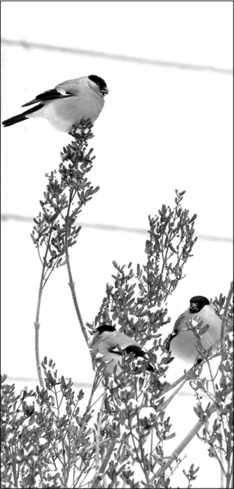
Птицы охотно посещают кормушки даже рядом с окнами, если туда регулярно подсыпают семечки подсолнечника, которые годятся в пищу не только синицам и голубям, но и снегирям и ещё более редким зимним пернатым гастролерам — шурам, которые невероятно красивы и выглядят настоящими гостями из сказки... А.Яновский, ИСЭЖ СО РАН

(Окончание. Начало на стр. 5) Из истории юбилеев РАН