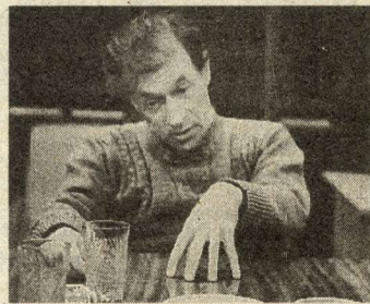
Стр. 3.

политическая фигура. Достаточно не иметь такой цели, достаточно быть у власти и не брать эту власть, чтобы стать белой вороной в этой среде. И такое положение не может длиться долго. Здесь есть момент для размышлений — какие могут быть отношения между ученым и властью. Я не изменил своих позиций. Я считал и считаю, что для ученого быть на политической работе не значит сменить систему ценностей, стать политиком. Но мы живем в такое время, когда пребывание в политике означает необходимость работать локтями, завоевывать настоящий политический статус, укреплять свою политическую силу. Я от этого решительно отказался, и, более того, очень не хотел, чтобы меня воспринимали скорее как политика, нежели как ученого. И надо сказать, в этом я преуспел, меня уже довольно давно не идентифицировали с политиками.