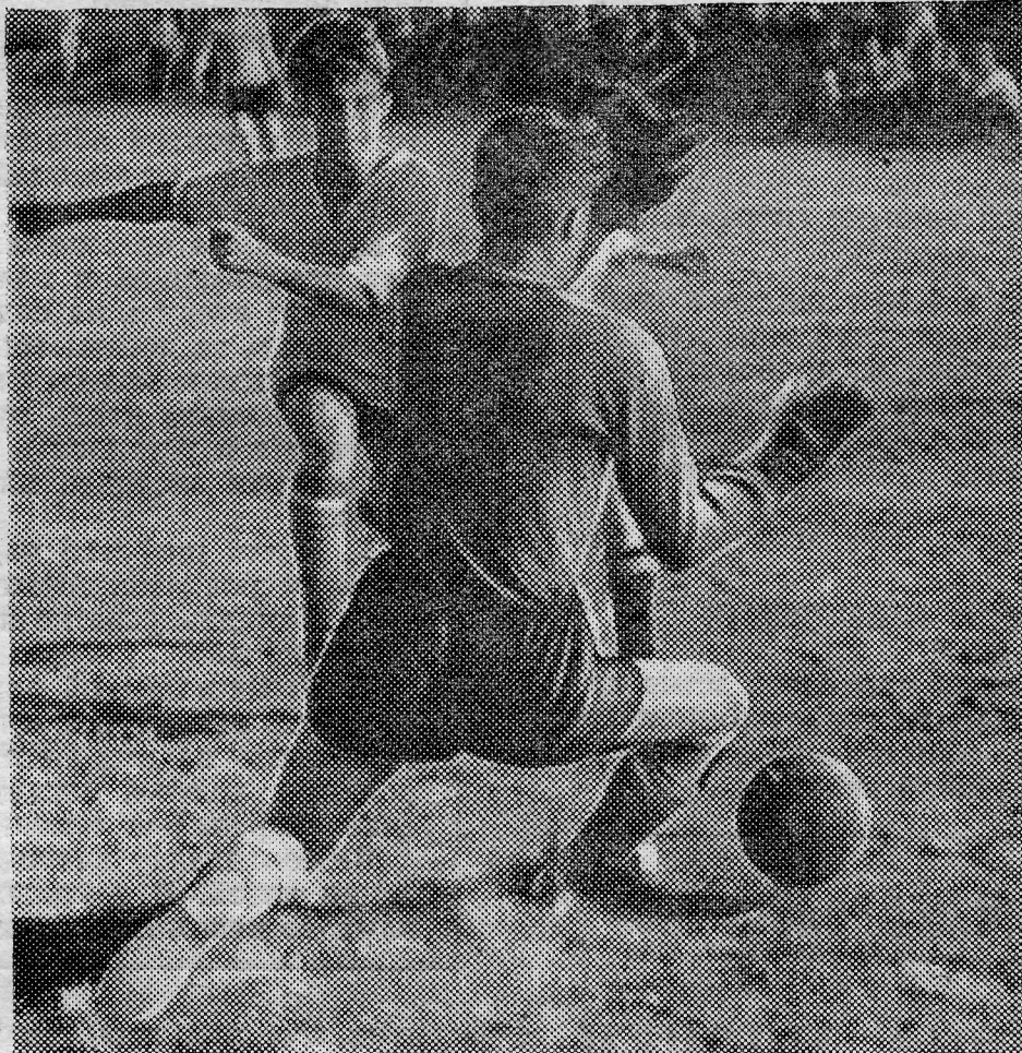
Когда замирают болельщики...