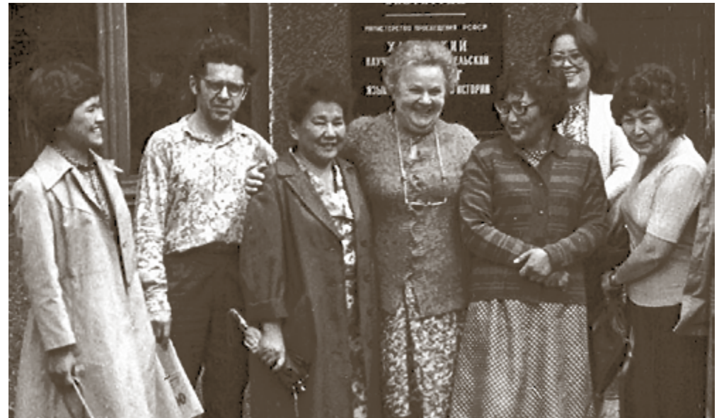
С хакасскими коллегами. Экспедиция 1982 года, Абакан

ного времени, в каком направлении нужно вести исследование».