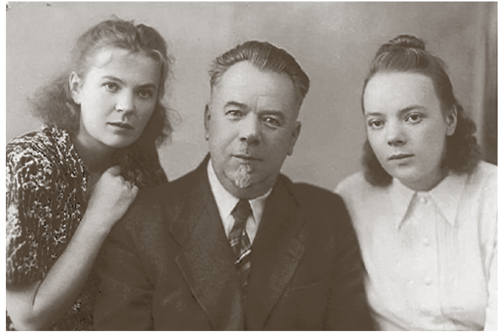
С отцом и сестрой. Москва, 1950 год