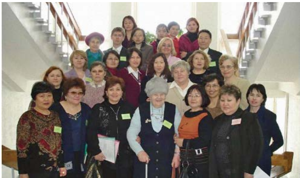
Участники конференции «Языки народов Сибири и сопредельных регионов», Новосибирск