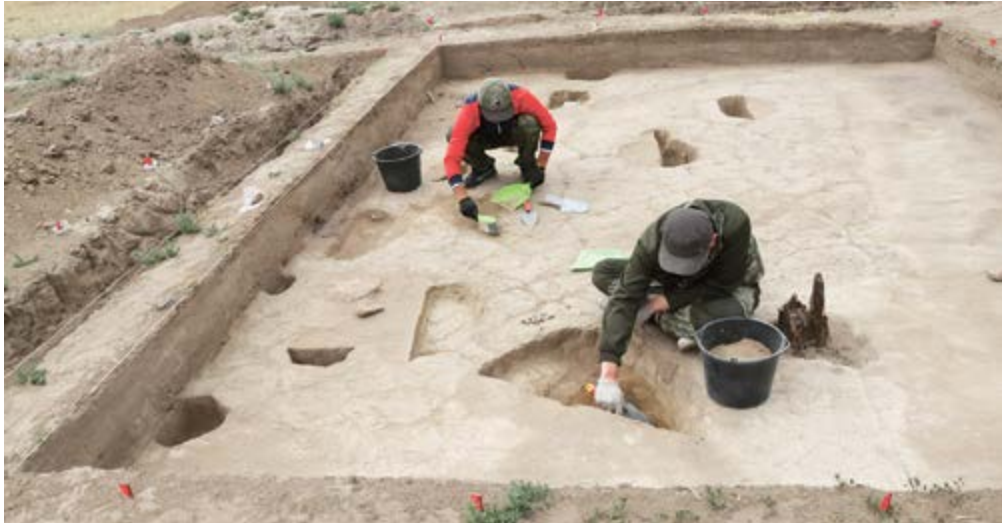
Иволгинское городище, 2019 г. Раскоп 4, разбор ям