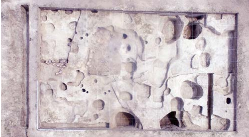
Иволгинское городище, 2018 г. Раскопы 2, 3 после снятия всех пластов

путем обтачивания. Эти ракушки имели широкую географию распространения еще в каменном веке. Они также фиксируются в неолитических погребениях Западного Забайкалья», — сказал Александр Симухин.