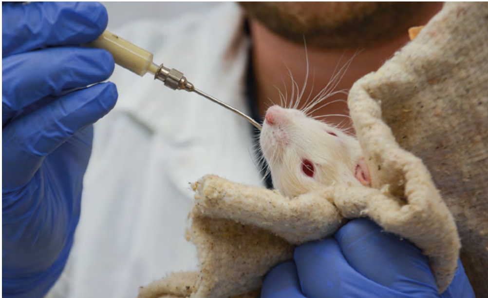
Испытание биодобавки на лабораторных животных