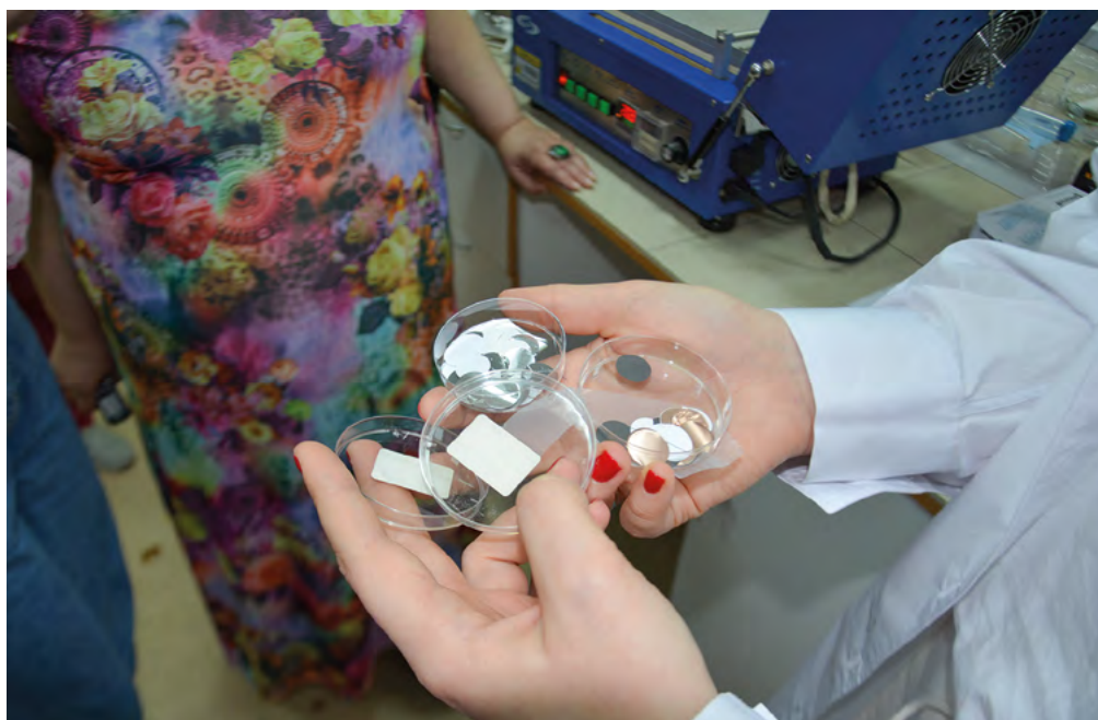
Заготовки с углеродным материалом, нанесенным на медную или алюминиевую подложку, которые потом используются в сборке аккумуляторов

По словам исследовательницы, новый способ уже опробован на имплантах из титана и углеродных композитных материалов, также сейчас ведется работа над нанесением пленки из платины на полимеры. Тесты in vitro подтвердили биосовместимость полученных образцов, in vivo — при имплантации на крысах (срок до пяти месяцев) — пока-