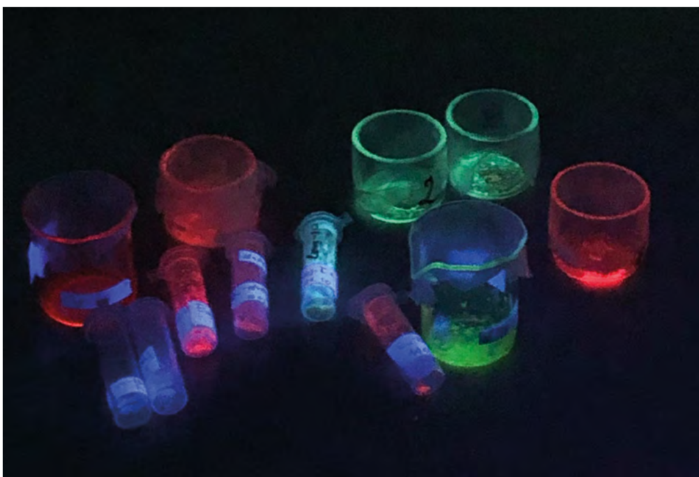
Люминесценция полученных соединений