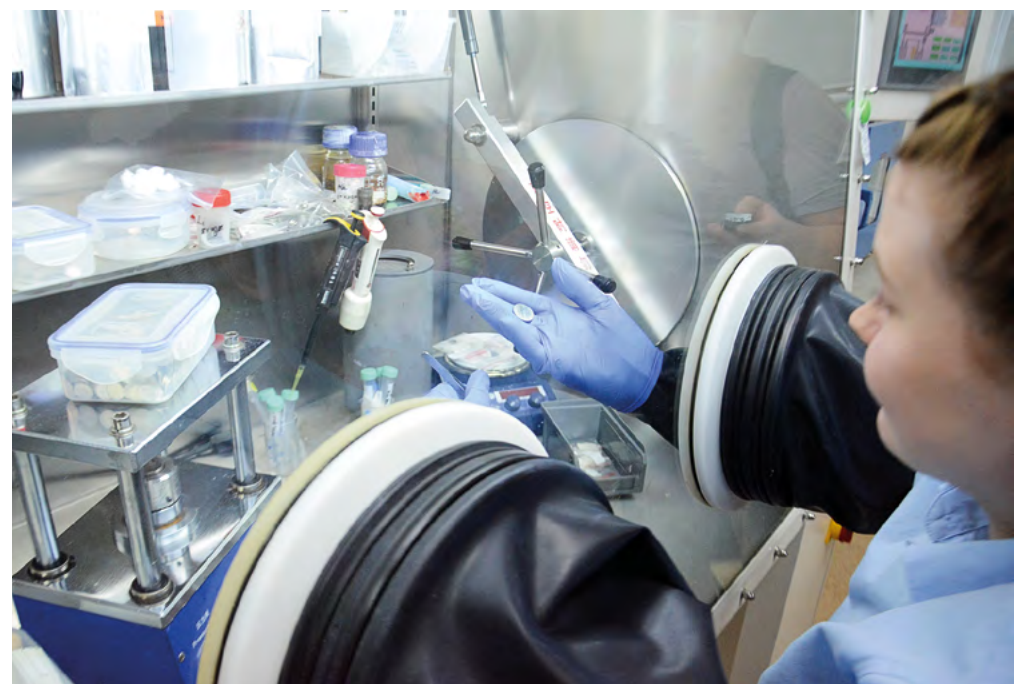
Сборка экспериментальных аккумуляторов